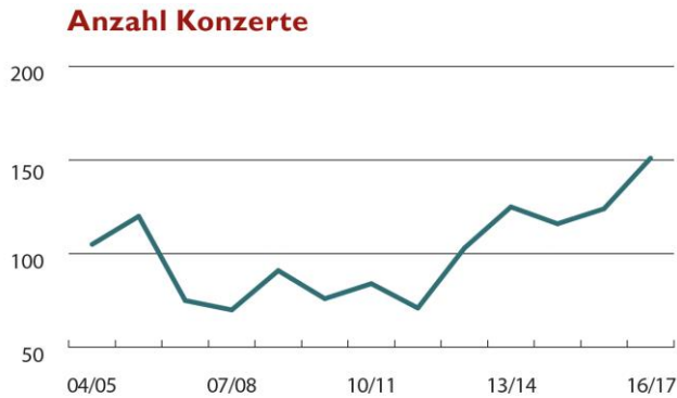
Grafik I: Entwicklung Anzahl Konzerte des ZKO seit Saison 2004/05